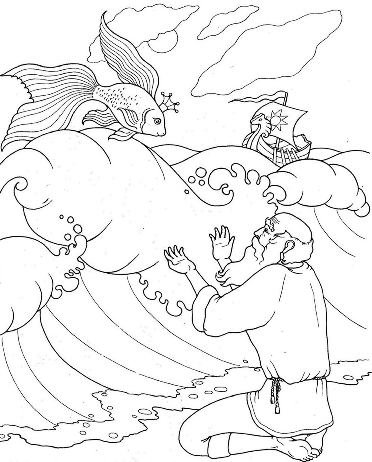
«Сказка о рыбаке и рыбке»